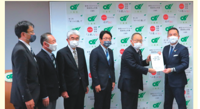
令和3年度当初予算に向けて 鈴木知事に提言書を手渡す (R2.12.17)