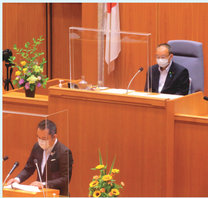
鈴木英敬知事 登壇