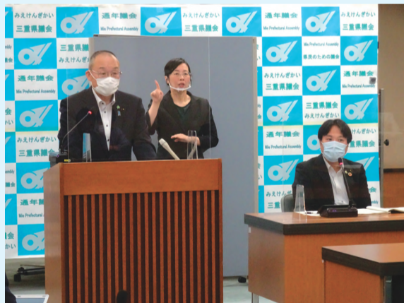
議長定例記者会見(毎月)